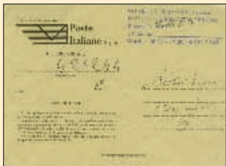
L'avviso postale ricevuto per il ritiro del pacco