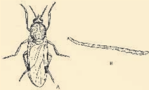
Culicoides (Culicoides) A) adulto, B) larva.