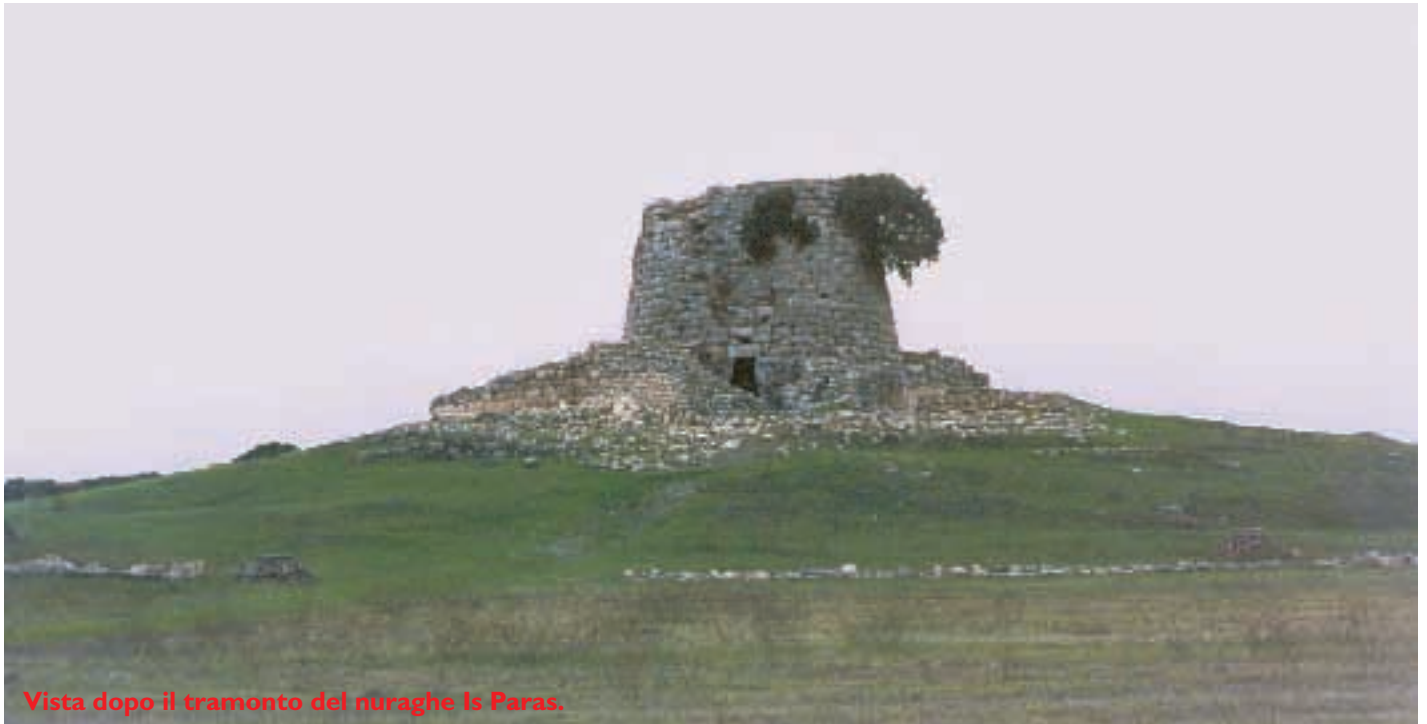
Vista dopo il tramonto del nuraghe Is Paras.

Schematizzazione della struttura di Nuraghe Arrubiu. La struttura era dotata di diversi cortili interni.