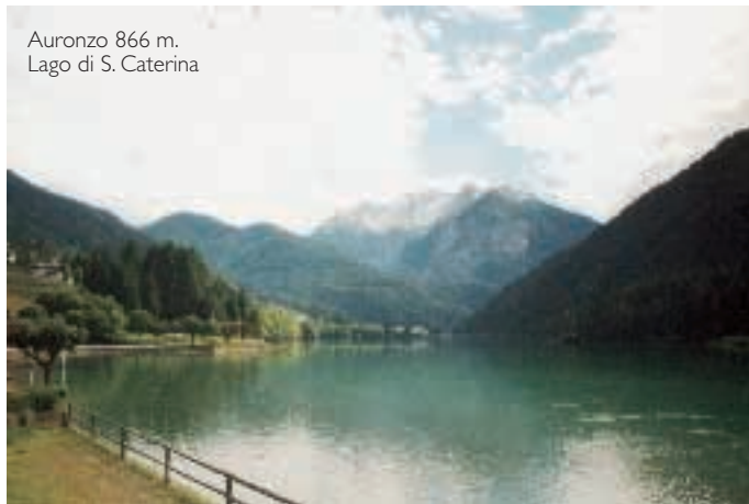
Auronzo 866 m. Lago di S. Caterina

Percorrendo la SS51 bis arrivati ad Auronzo, merita la visita il lago S.Caterina (Attenzione: al lago c'è DIVIETO DI SOSTA E FERMATA AI CAMPER) dopo 3 km. dal lago, in direzione Cortina D'Ampezzo troveremo la prima area attrezzata a pagamento e segnalata. Proseguendo sulla SS 48 ci troveremo alla nostra destra il PNR delle Dolomiti di Sesto, Auronzo e Comelico, mentre sulla sinistra avremo il PNR dell'Antelao, Marmarole e Sorapis. Da questi scenari meravigliosi, il vostro stupore non terminerà, anzi aumenterà quando vi troverete di fronte alle acque di un lago d'origine glaciale il lago di Misurina facente parte dell'omonima Riserva Naturale con la sua splendida