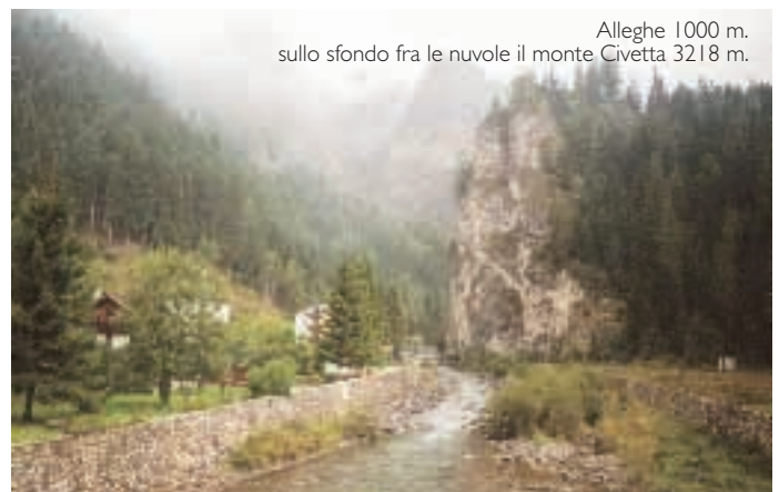
Alleghe 1000 m. sullo sfondo fra le nuvole il monte Civetta 3218 m.

Un' ultimo lago, non per bellezza ma solamente per esigenze di percorso è il Lago d'Alleghe, fiancheggiato da un'Area di Massima Tutela Paesaggistica, dove si trova il massiccio del Monte Civetta 3220 m. a Taibon Agordino è ubicato un altro presidio a pagamento, sempre segnalato.