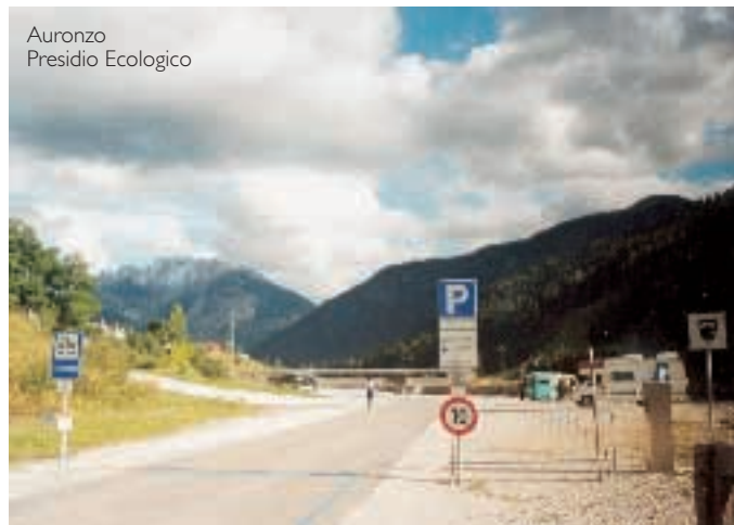
Auronzo Presidio Ecologico