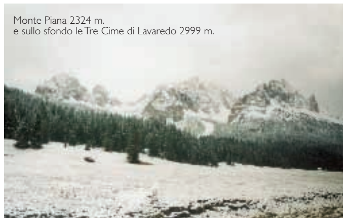
Monte Piana 2324 m. e sullo sfondo le Tre Cime di Lavaredo 2999 m.

cornice composta dal Gruppo del Sorapis 3205 m. e dalle Tre Cime di Lavaredo 2999 m.. Da qui arriveremo alla rinomata Cortina d'Ampezzo e troveremo in Loc. Fiammes un ampio parcheggio a pagamento con presidio ecologico. A questo punto potrete scegliere quale percorso seguire, si potrà ritornare verso la Valle del Cadore tramite la SS 51 oppure proseguire verso il Passo Falzarego tramite la SS 48. Ad Arabba troverete un'altra area di sosta, a fianco della pista di pattinaggio. Vi troverete ora nel mezzo delle Dolomiti, e dopo esservi arrampicati fino al Passo Pordoi 2239 m. potrete ammirare il Gruppo del Sella 2946 m. che si contrappone al Sassolungo 3181 m. ed alla conosciuta Marmolada 3340 m. che è il ghiacciaio più esteso e perenne del Veneto nonché sede di un famoso Museo della Grande Guerra (vedi "In Camper" n.78). Dirigetevi ora sulla SS 641, dove merita il passaggio nella Riserva Naturale Regionale "Serrai di Sottoguda", un'area d'elevato interesse geomorfologico e paesaggistico, che si attraversa percorrendo questa gola lunga 2 km e larga da 5 a 20 mt., al termine sarete giunti nel comune di Rocca Pietore.