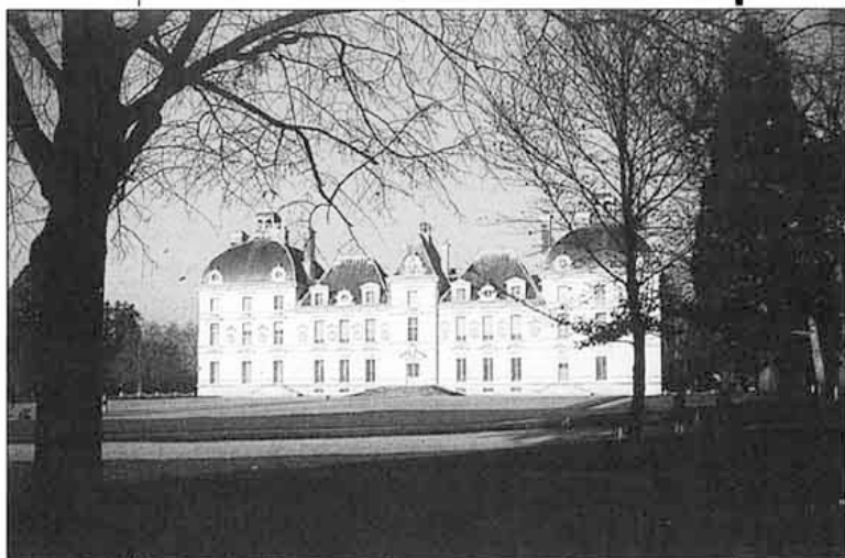
Castello di Cheverny

lia. Concludo sperando che la descrizione, molto sintetica, dei miei circa 4.000 Km di Francia, vi sia piaciuta e vi possa tornare utile.