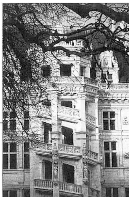
Castello di Blois (particolare)