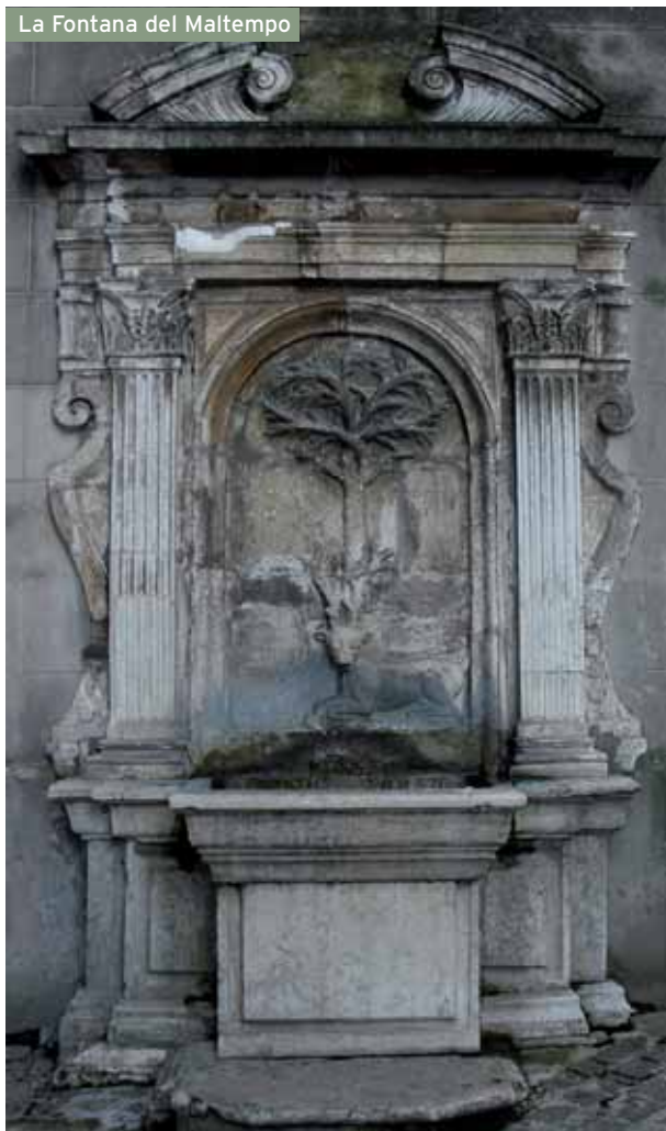
La Fontana del Maltempo

Ma Cingoli è nota anche per aver dato i natali a Francesco Saverio Castiglioni, nato qui nel 1761 e divenuto poi papa con il nome di Pio VIII, i suoi oggetti personali sono esposti nel Palazzo Castiglioni, edificio-museo eretto dai Marchesi omonimi nel 1760 che si nota per i due portoni gemelli ornati da altrettanti bei portali.