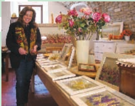
Bagno di Romagna, Un raro artigianato

Nel palazzo di via Fiorentina 38 che ha inizio qualche decina di milioni di anni fa.