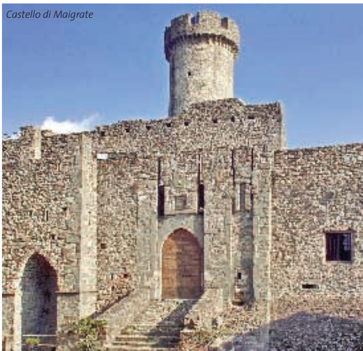
Castello di Maigrate