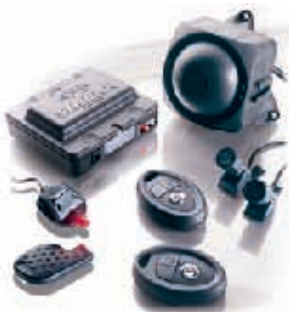
Antifurto SIKURA AZ2000

Altro accessorio sempre più richiesto nel settore autocaravan è il trasmettitore telefonico, abbinabile all'antifurto tradizionale, che per-