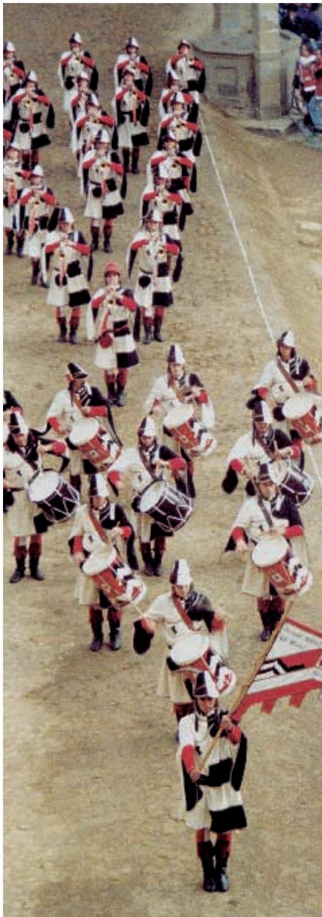
I musicisti schierati sulla lizza

suonavano nel 1955 al tempo della costituzione del gruppo e che da alcuni mesi stanno frequentando la sede dove si svolgono le prove ed hanno rispolverato gli spartiti riprendendo dimestichezza anche con il "passo cadenzato". Il direttivo ha inoltre deciso di utilizzare, in questa importante circostanza, gli abiti custoditi nella sede-museo del Gruppo, che furono realizzati nel 1956 da Novarese ed indossati, 50 anni or sono, dal neo "Corpo musicisti".