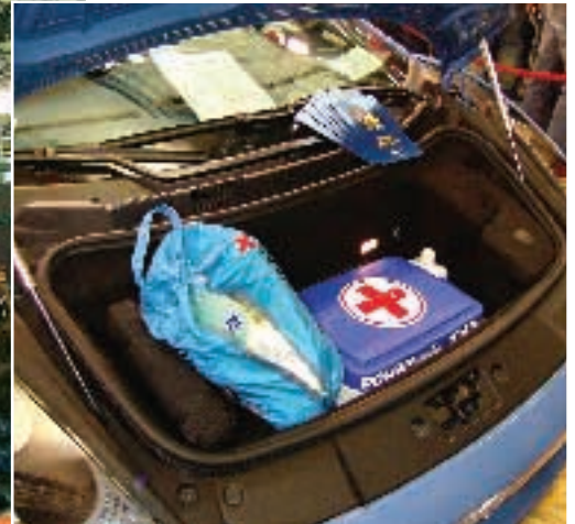
Defibrillatore e borsa contenente tutta l'attrezzatura per un primo soccorso che può rivelarsi utile, ad esempio, in caso di incidente stradale.