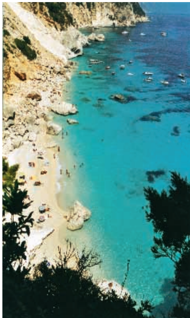
Cala Goloritzé vista dall'alto

Le notti sono assolutamente tranquille, le spiaggette solitarie che si affacciano su Porto Liccìa sono frequentate da pochissime persone, da qualche sospettoso cormorano e dai pochi gabbiani che al mattino presto o al tramonto vengono sulla spiaggia alla ricerca di eventuali resti di pic nic.