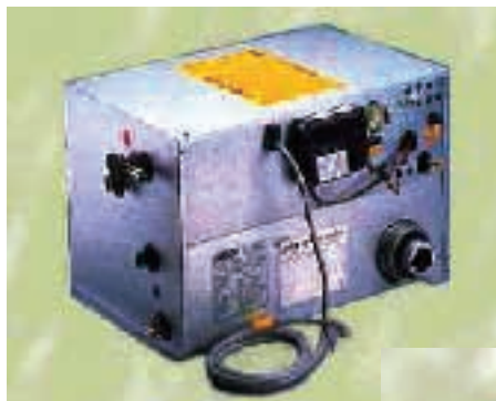
Produttore Alde International (UK) Ltd Regent Park, Park Farm South Wellingborough NN8 6GR.

Tra i pregi di questo sistema ci sono senza dubbio: la silenziosità, il basso consumo elettrico e la notevole riduzione di condensa sulle pareti.