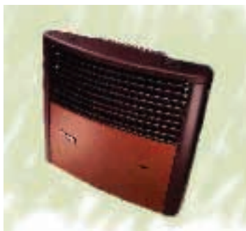
Immagini estratte da Catalogo 2005 della Dimatec spa - Via G. Galilei 7 22070 Guanzate (Co). Produttore Alde International (UK) Ltd - Regent Park, Park Farm South - Wellingborough NN8 6GR.

Di contro il termostato di tipo meccanico e posizionato alla base della stufa stessa che rende (in alcuni casi) problematica la regolazione della temperatura nell'autocaravan.