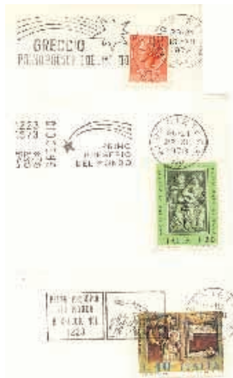
A sinistra: pubblicazione edita dal "Gruppo Amici del Presepe" - Abbazia San Salvatore - (Si).

Questa "antica tradizione tipicamente italiana" è legata all'industria e all'artigianato delle figurine da presepe, che si esprime solo nel periodo natalizio ma che impegna tutti gli altri mesi dell'anno per preparare questo importante momento. Il lavoro di queste aziende italiane viene esportato in tutto il mondo; è iniziato con le statue di gesso per poi passare alla carta pressata ed arrivare alla plastica e alle resine. Non ci possiamo dimenticare però di quelle figure del presepe fatte in legno che sono diventate oggetti da collezione e che si trovano solo in alcuni musei, chiese o in collezioni private. A questo proposito è interessante il Museo della statuina di gesso di Coreglia Antelminelli (Lu). Aspettiamo le prossime festività con l'idea di andare a visitare uno o più di questi Presepi che sono una tradizione viva, creativa e talvolta artisticamente importante del nostro paese.