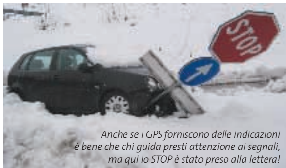
Anche se i GPS forniscono delle indicazioni è bene che chi guida presti attenzione ai segnali, ma qui lo STOP è stato preso alla lettera!

di pericolo o avvertimento. Ogni volta che si accende un GPS appare un messaggio che l'utente deve accettare prima di proseguire, che avverte che non ci si deve affidare al navigatore ma occorre osservare la segnaletica sulla strada. Ad esempio: i GPS conoscono i sensi unici (questi sì che sono segnali e da conoscere per il calcolo del percorso) ma non possono garantire che non siano cambiati, quindi, il guidatore deve comunque tenere gli occhi aperti e se il navigatore dice "svolta a destra" non lo deve fare se vede un divieto di accesso e/o una deviazione per lavori.