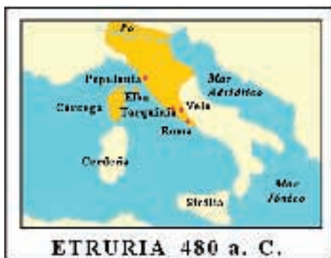
ETRURIA 480 a. C.

Nessun dubbio sul fatto che gli antichi Egizi conoscessero il vino: reperti di vino fossile rinvenuti a Tebe si sono rivelati quasi identici a quelli iraniani.