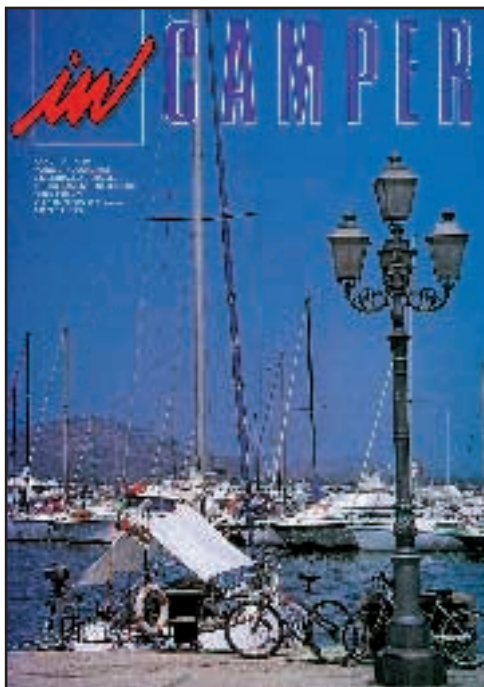
N° 60 - MAGGIO / AGOSTO 1998