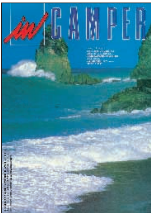
N° 61 - SETTEMBRE / OTTOBRE 1998