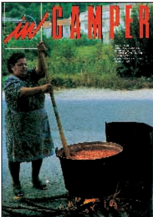
N° 58 - GENNAIO / FEBBRAIO 1998