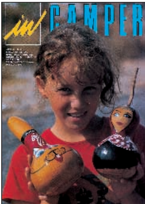
N° 59 - MARZO / APRILE 1998

A fine anno registriamo 1.386 equipaggi associati.