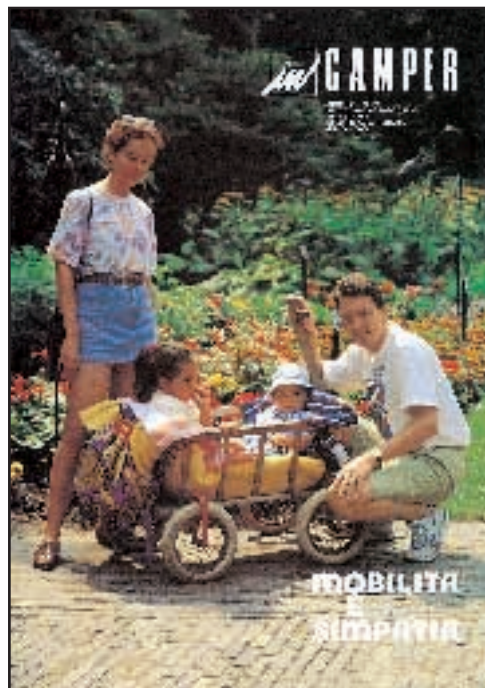
N° 27 - SETTEMBRE / OTTOBRE 1992