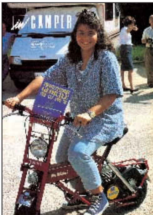
N° 26 - LUGLIO / AGOSTO 1992