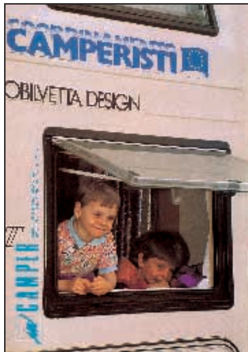
N° 25 - MAGGIO / GIUGNO 1992