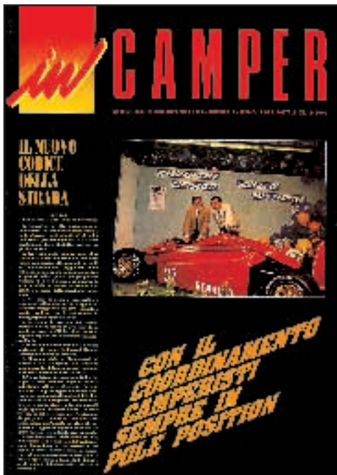
N° 23 / 24 - GENNAIO / APRILE 1992