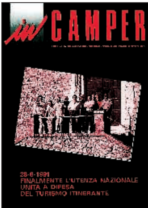
N° 20 - LUGLIO / AGOSTO 1991