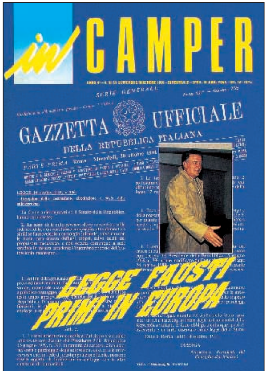
N° 21 / 22 - SETTEMBRE / DICEMBRE 1991

A fine anno registriamo 2.900 equipaggi associati.