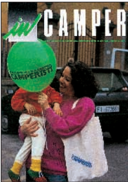
N° 11 / 12 - GENNAIO / APRILE 1990