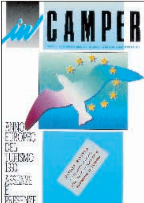
N° 15 / 16 - SETTEMBRE / DICEMBRE 1990