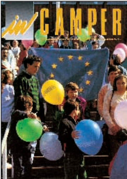
N° 13 - MAGGIO / GIUGNO 1990