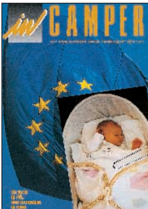
N° 9 - SETTEMBRE / OTTOBRE 1989