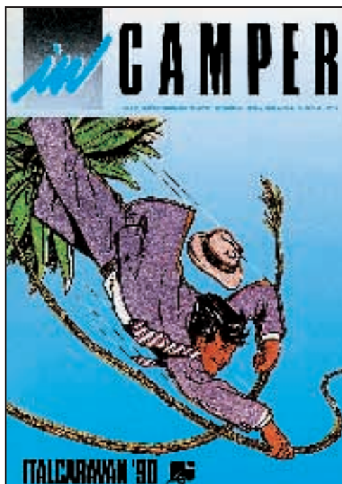
N° 10 - NOVEMBRE / DICEMBRE 1989