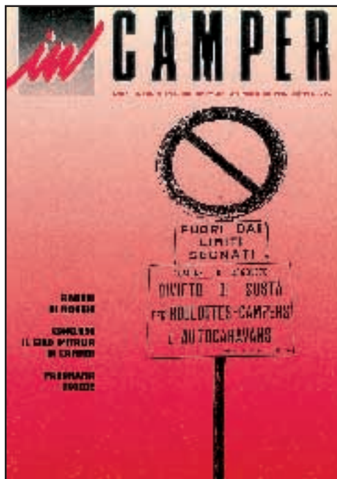
N° 6 - MARZO / APRILE 1989