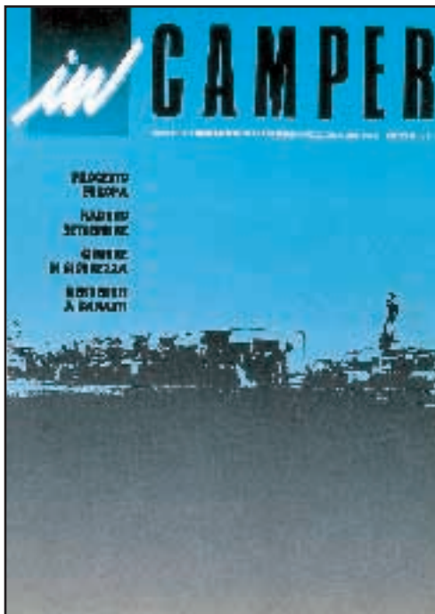
N° 7 - MAGGIO / GIUGNO 1989