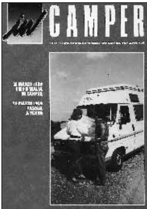
N° 5 - GENNAIO / FEBBRAIO 1989