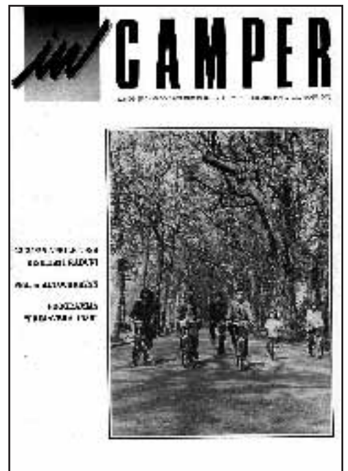
N° 3 - MAGGIO / GIUGNO 1988