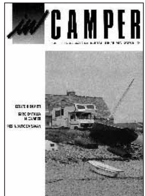
N° 4 - LUGLIO / AGOSTO 1988