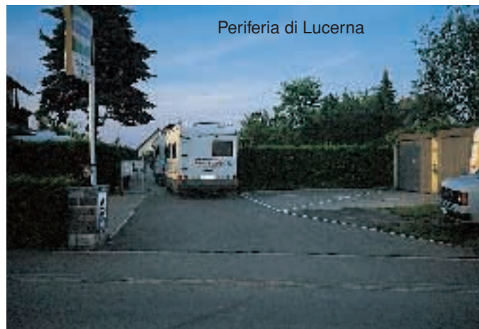
Periferia di Lucerna

(CH) BERNA: Camp. T.C.S. KAPPELENBRUCKE.