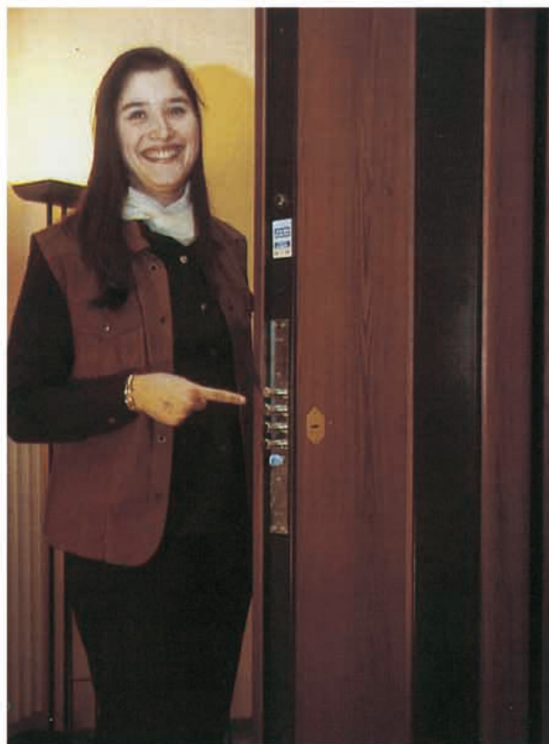
serratura da infilare

chiave costanza fissa, 15.000 combinazioni