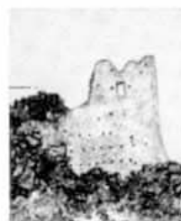
I resti del castello

La battaglia ebbe un peso decisivo dal punto di vista politico, perché portò Enrico IV ad abdicare a favore del figlio, Enrico V.