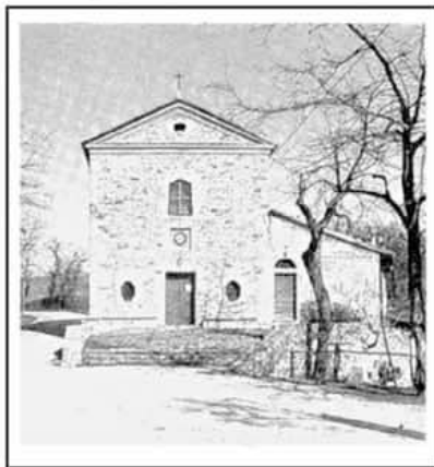
Chiesa Madonna della battaglia

Il paese di Quattro Castella conserva tra le altre cose un'interessante pieve di origine romanica.