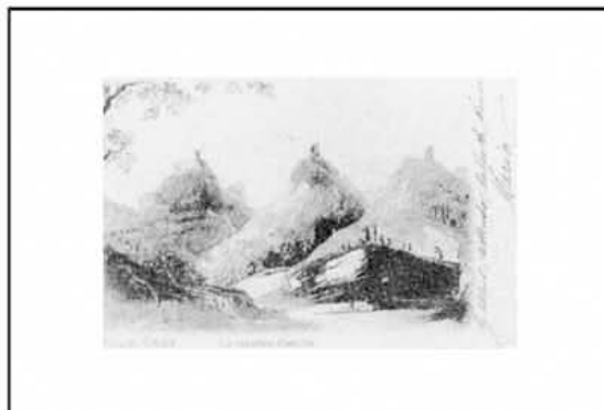
Reggio Emilia: le Quattro Castella

Nelle prossime pagine cercheremo di dare una panoramica delle bellezze (e delle... bontà!) che potrete trovare nella terra di Matilde.