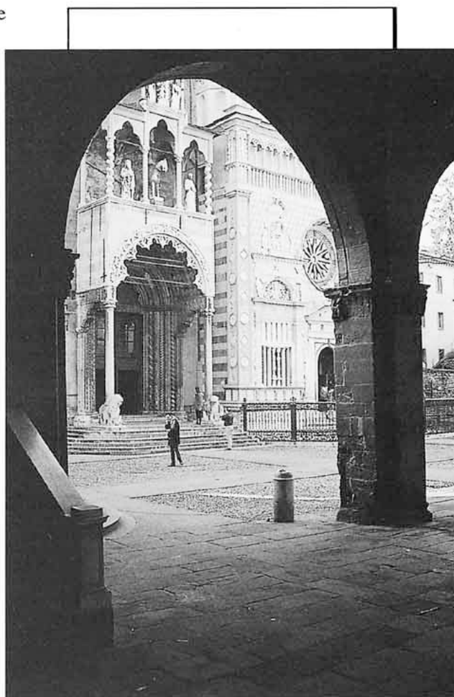
Dal loggiato del palazzo della Ragione l'ingresso a Santa Maria Maggiore in piazza del Duomo.

Chi è invogliato a scoprire, con i suoi occhi, un simile gioiello, deve attraversare tutta Bergamo (direzione Bergamo Alta): percorrere viale Vittorio Emanuele II e alla sua sommità varcare la porta S. Agostino, girare subito a sinistra sul viale delle Mura e posteggiare, dopo qualche decina di metri, su un piccolo piazzale sterrato.