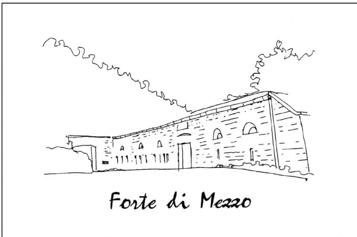
Forte di Mezzo

seguire la segnaletica per Maderno e Maso Bergamini.