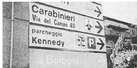
Il cartello con l'indicazione di parcheggio per i camper

Egregio direttore, tramite il suo giornale vorrei fare un ringraziamento e dare anche una informazione. L'Amministrazione Comunale di Ferrara ha difatti installato nelle inserzioni stradali cittadine più importanti, dei segnali direzionali per camperisti, indicanti il punto attrezzato ed il parcheggio