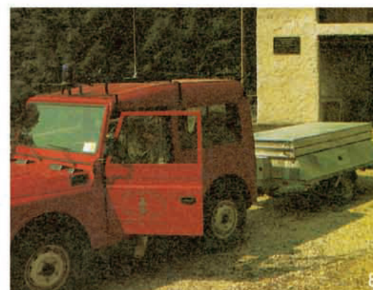
8 Unità Mobile Protezione Civile Disaster Ade Mobile Unit