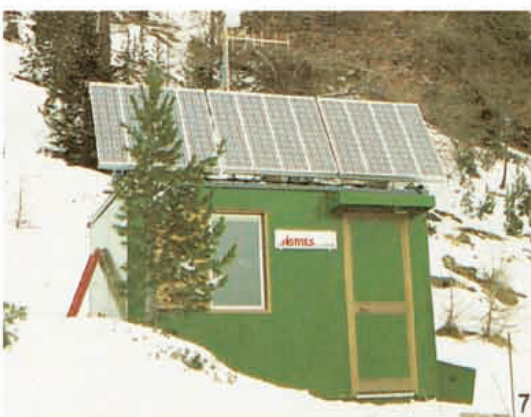
7 Telerilevamento Frane - Valanghe Landslides - Avalanches Telemetry