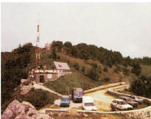
5 Ripetitore Radio-TV 1,7 KWP Vicenza - 1984 Radio-TV Repeater 1,7 KWP Vicenza - 1984