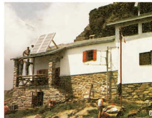
6 Rifugio Alpino Valtellina - 1985 Alpine Shelter Valtellina - 1985