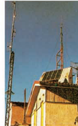
4 Trasmissione Dati Data Relays Systems