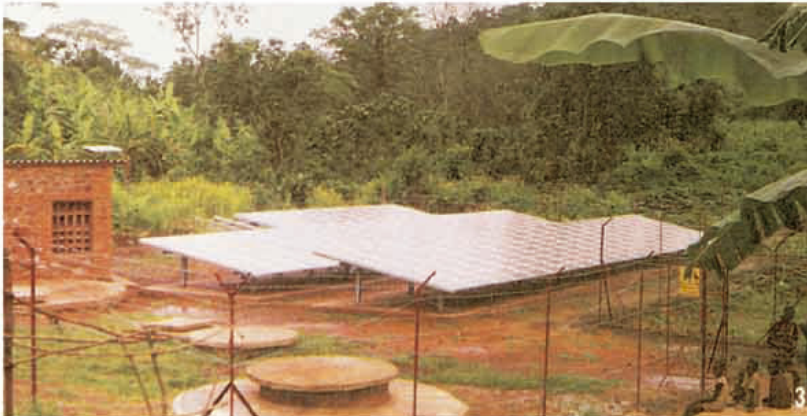
3 Pompaggio Acqua Moduli FV - 18 KWP Burundi - 1985 Water Pumping System PV Plant - 18 KWP Burundi - 1985