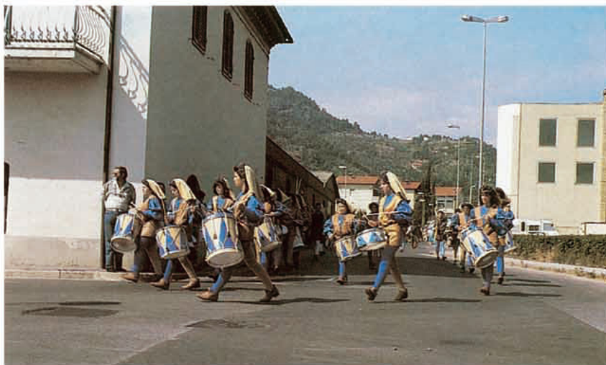
Pescia (PT) - Sfilata storica nella piazza del Raduno - settembre '91.

Si definisce il Giro d'Italia in Camper per il 1989 onde sollecitare l'iter parlamentare della Pdl 1456.