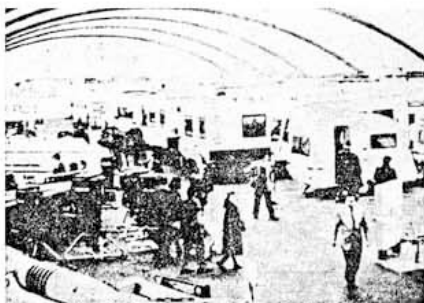
Uno dei padiglioni di Italia Vacanze al Parco esposizioni di Novegro