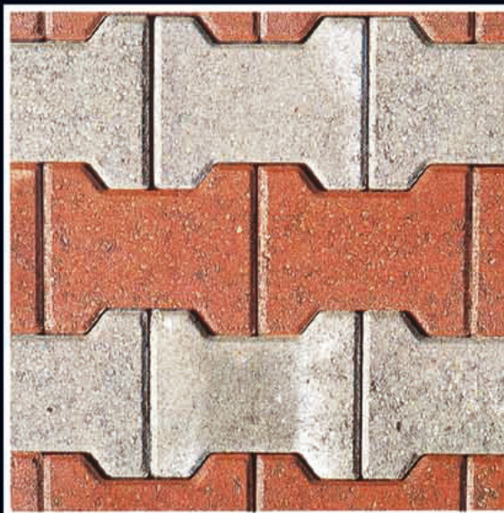
Pavimentazione tipo «ETA»