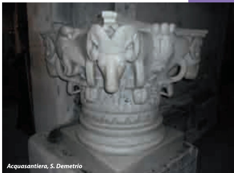
Acquasantiera, S. Demetrio

Oltre alla chiesa di S. Giorgio, c'erano altre cose da vedere, come l'acropoli, in alto, dove si dovrebbe godere di un bel panorama su tutta la città. Ma sarà per un'altra volta, non abbiamo la forza di vedere altro. La nostra è soprattutto una stanchezza psichica derivante dal grande caldo e dalla cocente delusione di aver visitato la mitica Salonicco, oramai ridotta a un qualunque brutto paese del sud.