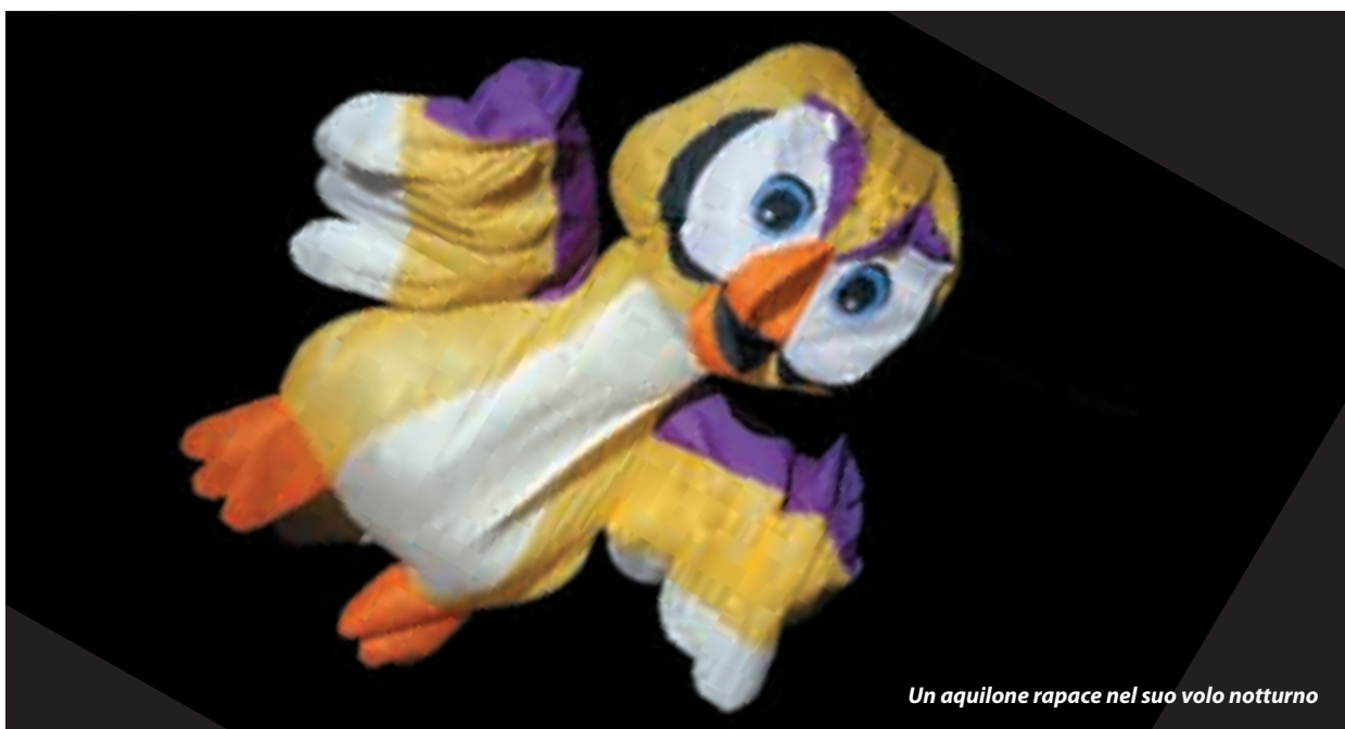
Un aquilone rapace nel suo volo notturno