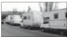
La sosta dei camper lungo via Canale non sarà più tollerata

Da settembre le case viaggiatrici fuori da una prima lista di strade. Costerà 250 euro all'anno il park