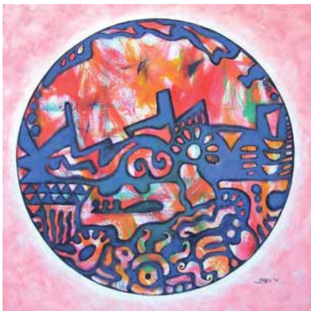
Configurazione morfologica, Acrilico su tavola, cm 70x70