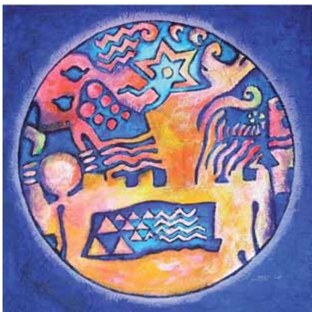
Favola, Acrilico su tavola, cm 70x70