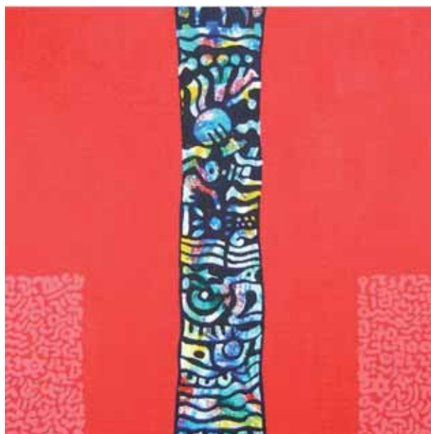
Passaggio nel rosso, Acrilico su tavola, cm 70x70

I riferimenti alla realtà oggettuale, quando presenti e ribaditi nei titoli, hanno spesso a che fare con un passato primigenio, ancestrale, con un tempo in cui le lingue erano un suono che si andava via via diversificando, la scrittura un codice che si stava perfezionando.