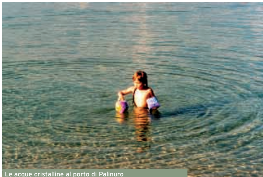
Le acque cristalline al porto di Palinuro